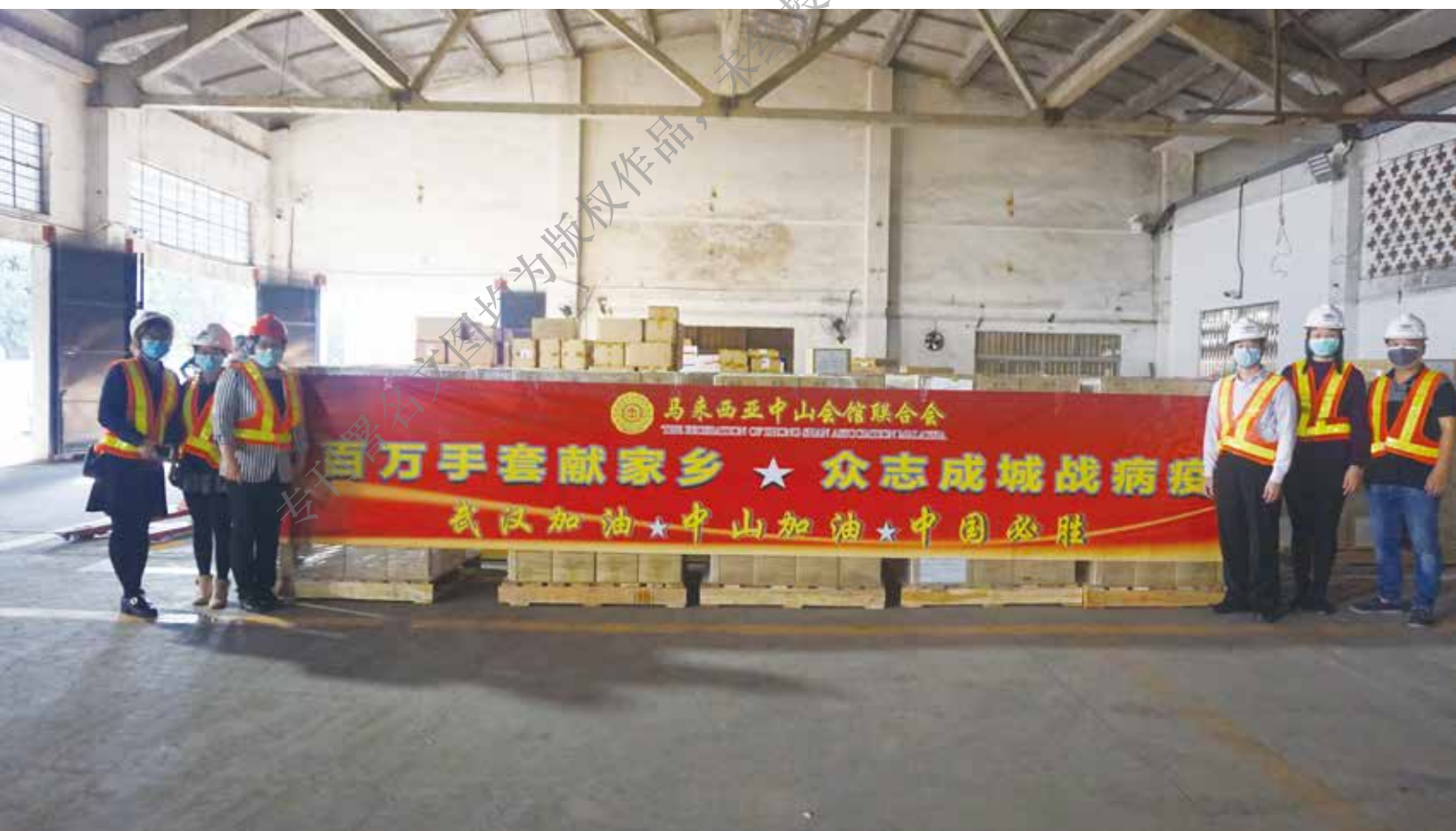
2020年2月26日，马来西亚中山会馆联合会援助家乡的100万只医疗橡胶手套抵达中山。

They looked for heartwarming stories during the pandemic, including the touching stories of front-line personnel and the support and concern of all sectors of society, and provided objective, practical and warm reports to comfort people during this critical period.