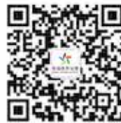
公益体彩 官方微信