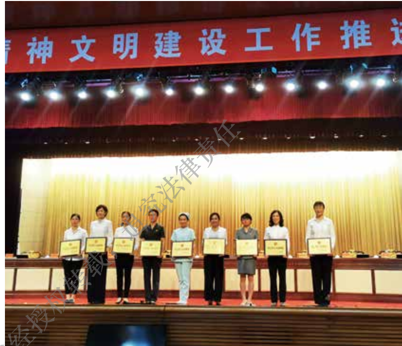
2020年8月，中山市侨联疫情防控工作组荣获“中山市三八红旗集体”称号。