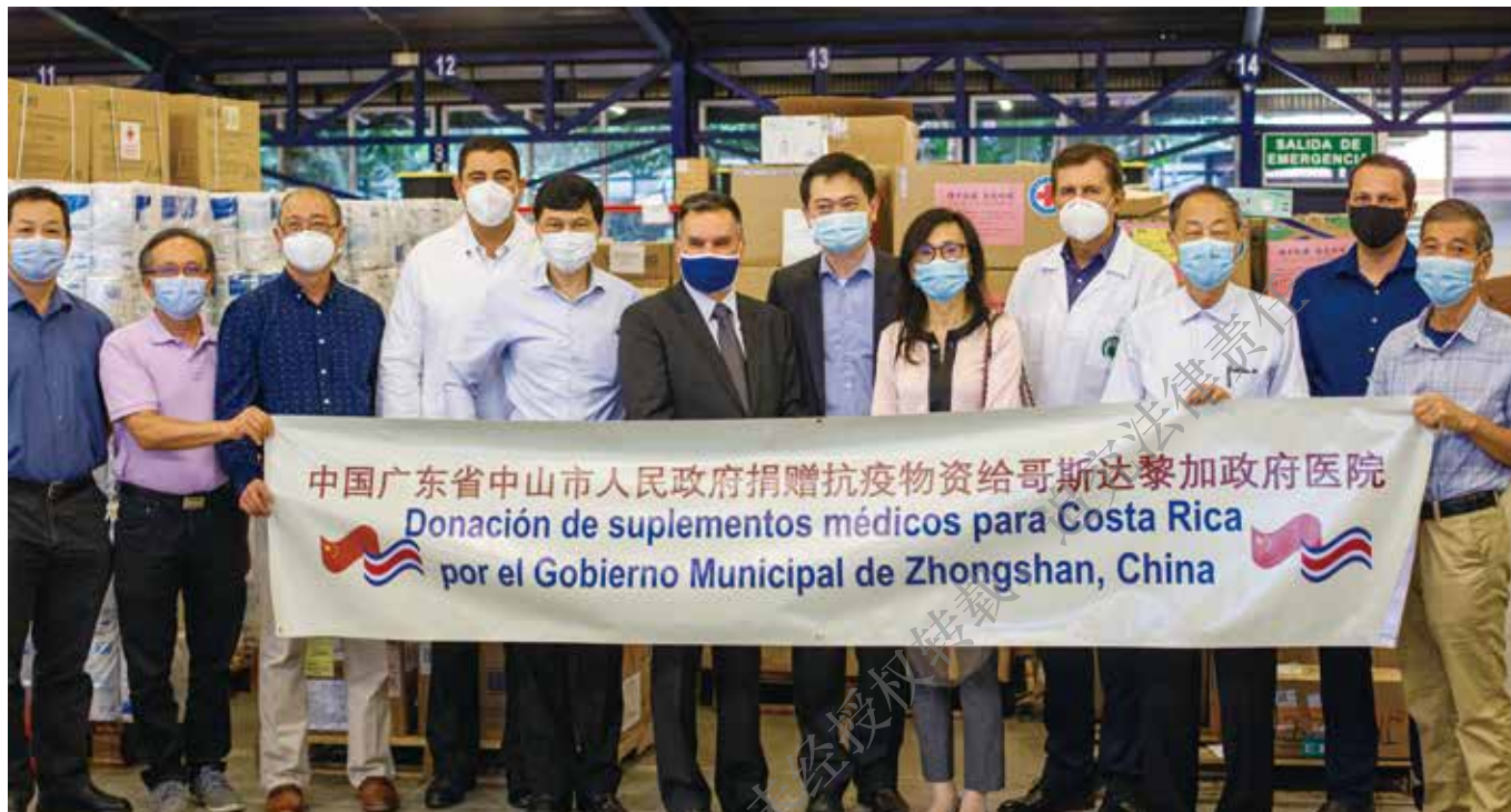
哥斯达黎加华侨华人华裔协会协助接收家乡捐赠给哥斯达黎加医院的防疫物资。

间，筹集到4万多美元，购买咖啡、牛奶、意大利面等食品，捐给当地近2000户家庭。