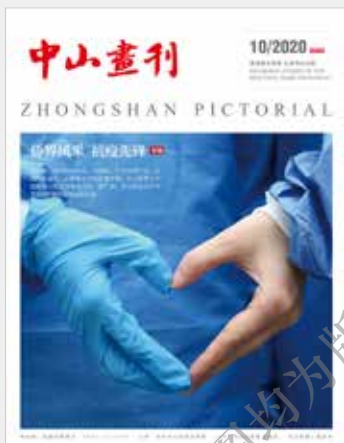
封面图：海内外乡亲齐心协力战“疫”。