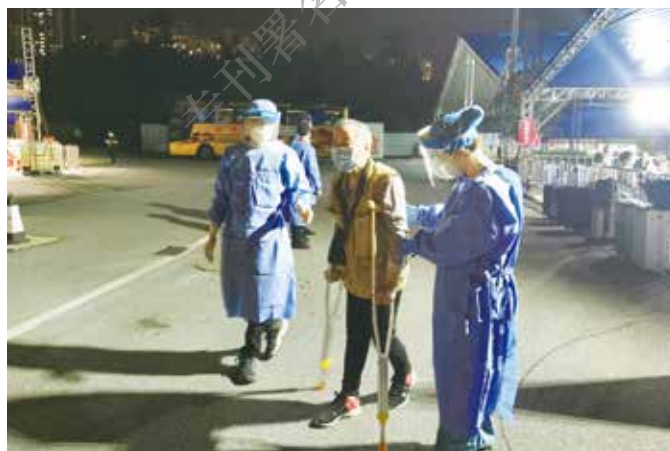
2020年4月21日，在火炬开发区中转站隔离酒店的抗疫工作人员为行动不便的老人提供帮助。（摄影 | 梁紫霖）