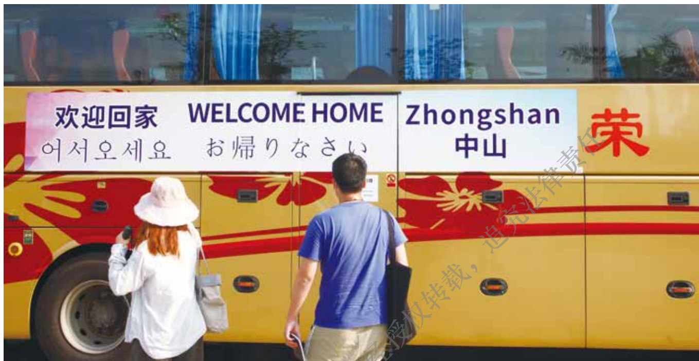
海外乡亲乘坐专班到达火炬开发区中转站隔离酒店。

In this "battle" against the pandemic, the overseas Chinese of Zhongshan have always joined hands with the motherland. When the domestic medical supplies were in shortage, boxes of precious relief supplies were delivered across the sea, traveling thousands of miles for help. When the pandemic was under control at home but began to spread abroad, the "heart-warming bags" were sent to overseas Chinese from the home country, together with our care and condolences.