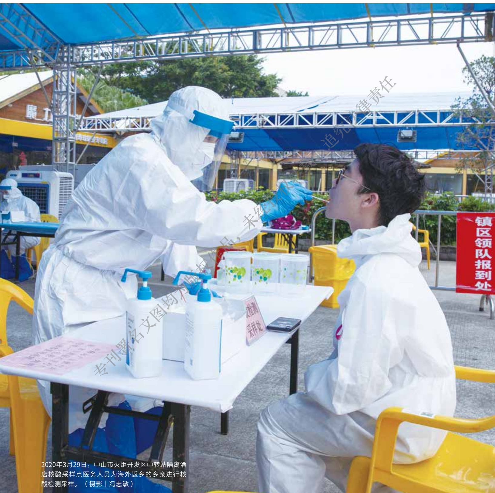
2020年3月29日，中山市火炬开发区中转站隔离酒店核酸采样点医务人员为海外返乡的乡亲进行核酸检测采样。