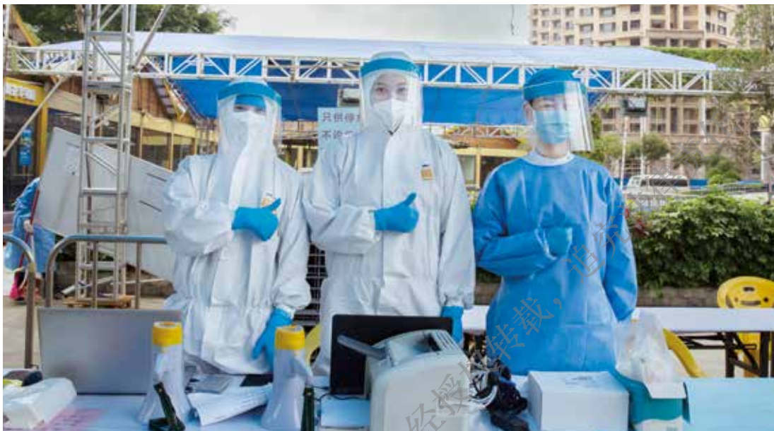
2020年3月29日，中山火炬开发区中转站隔离酒店核酸采样点医务人员24小时坚守。